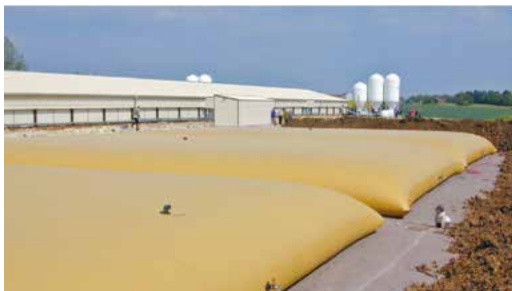
Réservoirs pour le stockage du lisier