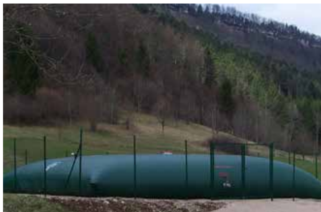
Réservoir pour le stockage de l'eau

Les réservoirs pour le stockage de l'eau et du lisier peuvent être fabriqués sur mesure, ceci concerne également l'emplacement des ouvertures