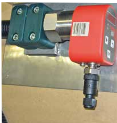
Gas H Meter