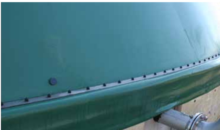
Fermeture en acier inox étanche aux gaz

Système complet combiné et sophistiqué pour couverture et réservoir de gaz.