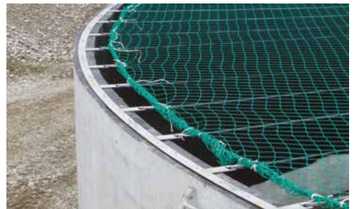
Armature avec filet