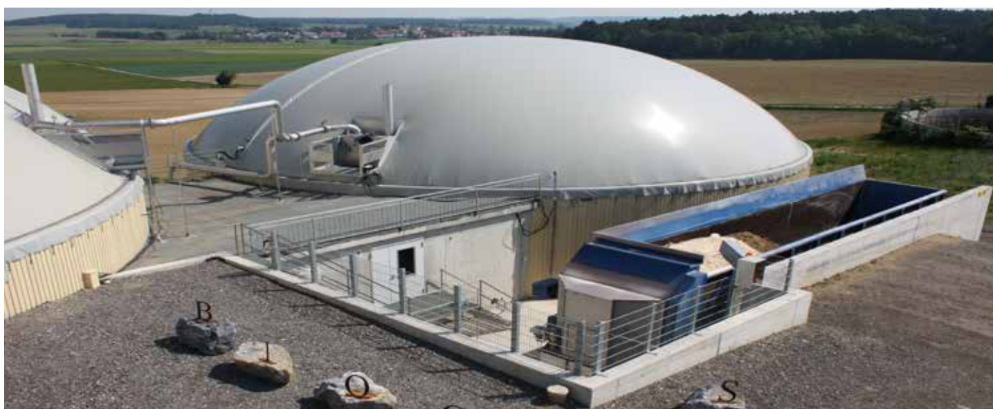
Installation du puits de service