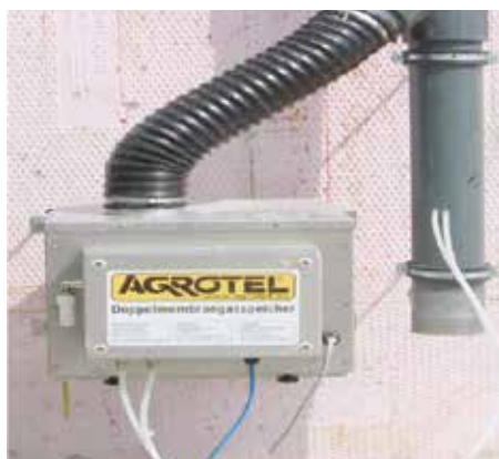
Soufflerie avec réglage de pression