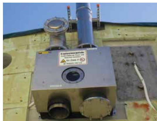
Sécurité sur et sous pression