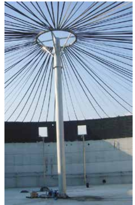
Réservoir à membrane double